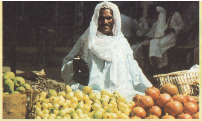
«F & G»-Abteilung in Luxor